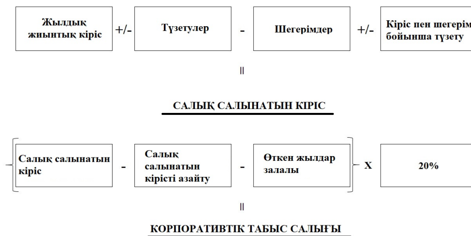
Сурет 1 – Корпоративтік табыс салығының есептеу схемасы

Салық базасын қалыптастыру процесін, сондай-ақ корпоративті табыс салығының сомасын есептеуді жақсы түсіну үшін біз төмендегі суретте корпоративтік табыс салығының есептеу схемасын көрсеттік (сурет 1).