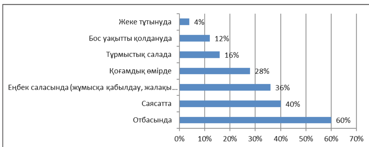
Сурет 2 – Салалар бойынша ерлер мен әйелдер арасындағы теңсіздіктің орын алуы

«Қазақстан Республикасындағы Гендерлік теңдік стратегиясының» негізгі ережелері жайлы халықтың негізгі ақпарат алу көздері ретінде интернет және бұқаралық ақпарат құралдарын атаған (сурет 2).