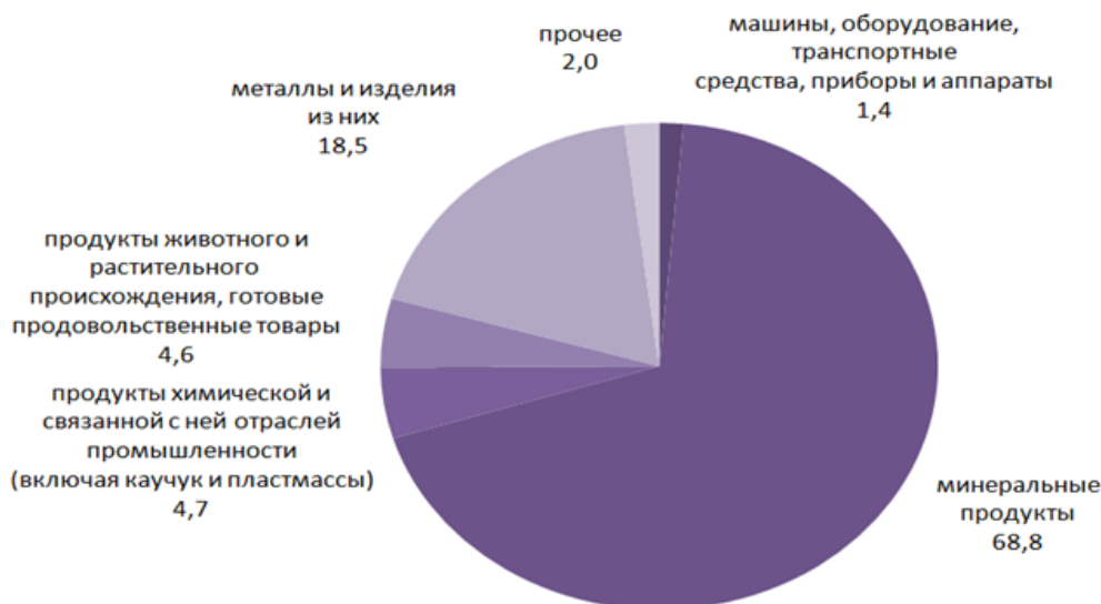
Рисунок 2 – Структура казахстанского экспорта за 10 месяцев 2017 г. в %

Наряду с сильными сторонами у Казахстана имеется ряд потенциальных ограничивающих факторов. В частности, это касается структуры экспорта. В структуре экспортных товаров традиционно преобладают минеральные продукты (68,8% от общего объема экспорта), в том числе экспорт нефти и газовый конденсат (рисунок 2). По данным Комитета по статистике, экспорт Казахстана в октябре 2017 г. вырос на 48% к соответствующему месяцу предыдущего года благодаря улучшению внешнеэкономической конъюнктуры на рынках энергоносителей [3].