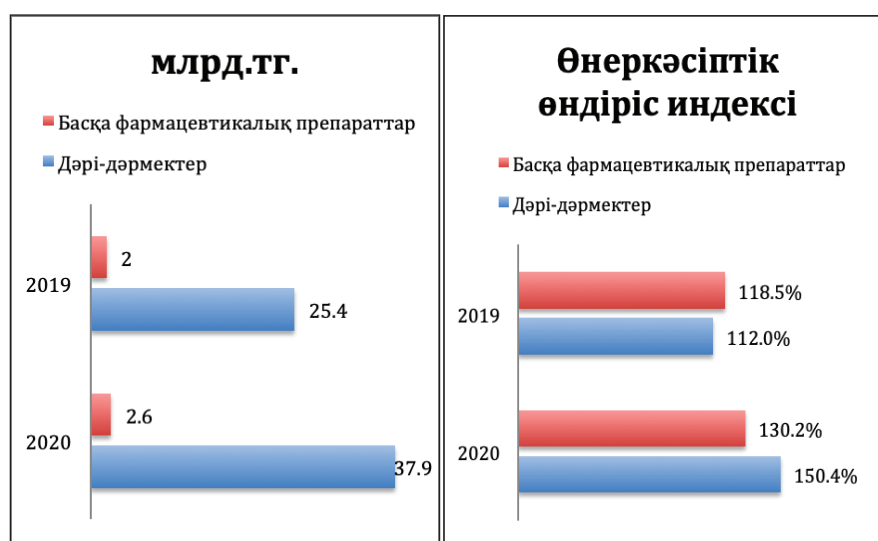
Сурет 2 – Негізгі фармацевтикалық өнімдердің өндірісі. Өткен жылдың сәйкес айына (мамыр) %-да/сомада (млрд тг) [3]

Тікелей дәрі-дәрмек өндірісі 37,9 млрд теңгені (6,55 млрд рубль) құрады, нақты өсім өткен жылмен салыстырғанда 50,4% құрады. Өндірістің ең үлкен көлемі Шымкентке тиесілі (11,4 млрд теңге – 1,97 млрд рубль (сурет 2)).