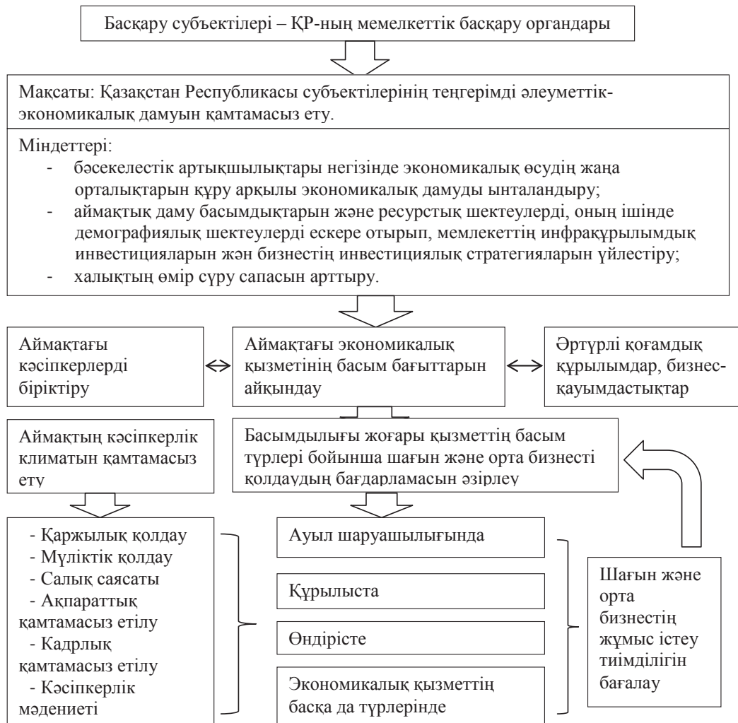
Сурет 1 – Қызметтің басым түрлерін (драйвер) анықтау моделі

Ескертпе – Дереккөз негізінде автормен құрастырылған.