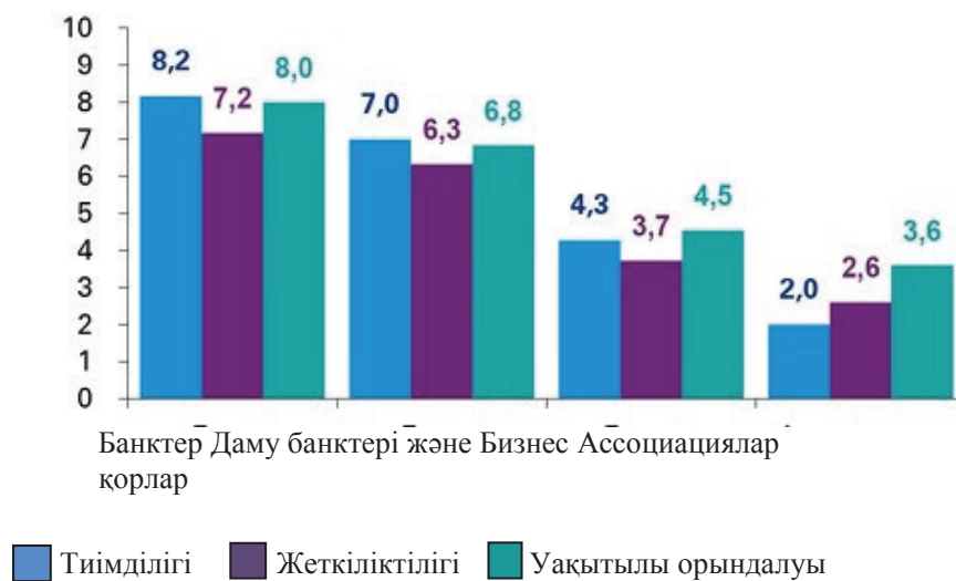
Сурет 3 – 2017–2020 жылдар арасындағы мемлекет тарапынан қолдау алатын бағдарламалардың тиімділігін, жеткіліктілігін, уақытылы орындалуын бағалау

Ескертпе – Дереккөз негізінде автормен құрастырылған.