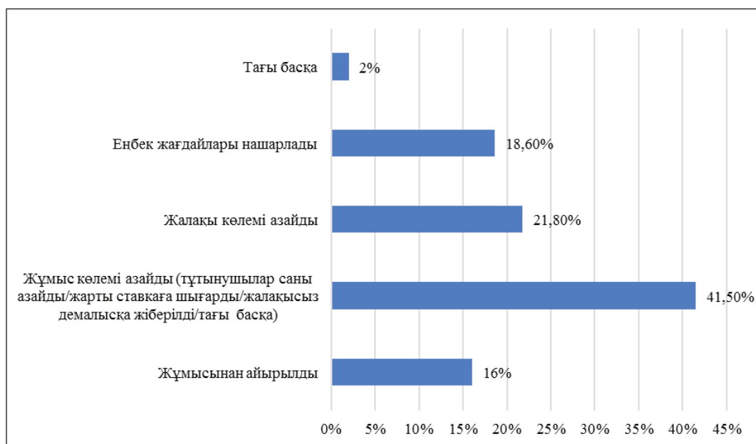
Сурет 3 – COVID–19 пандемиясының кері әсеріне байланысты респонденттердің (аймақтар бойынша) жұмысқа орналасу қиындығы, (%) (Жұмысқа орналасуда COVID–19 пандемиясының кері әсерін сезінген респонденттер арасында)

Ескертпе – Сауалнама нәтижелері бойынша авторлар құрастырған.