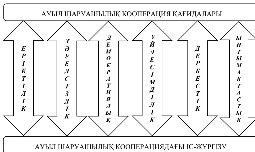
Сурет 2 – Классикалық ауыл шаруашылық кооперация қағидалары

Ескертпе – [8, 9] дереккөздер негізінде құрастырылған.