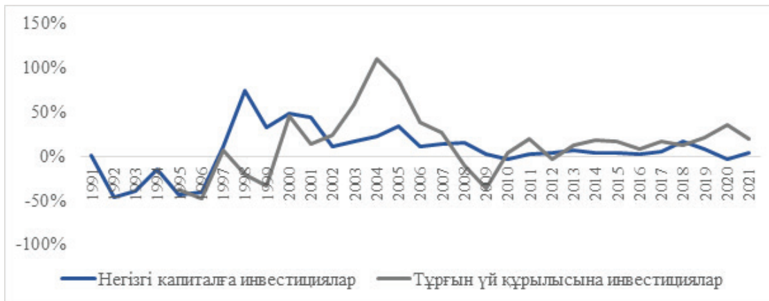
Сурет 2 – Қазақстандағы тұрғын үй құрылысына инвестициялар және негізгі капиталға инвестициялар серпіні, %

Негізгі капиталға инвестициялардың төмендеуі де экономикаға теріс әсер етті, 2020 ж. қортындысы бойынша ол 3,9% қысқарды (2-сурет). Негізгі төмендеулер келесі салаларда орын алды: тау-кен өнеркәсібі (-29,8%), көтерме және бөлшек сауда, автокөліктерді жөндеу (-19,3%), электрмен қамтамасыз ету, газ, будың берілуі және ауаны баптау (-18,3%), қаржылық және сақтандыру қызметі (-15%), тамақтану және өмір сүру бойынша қызметтер (-4,9%). 2021 ж. қортындысы бойынша негізгі капиталға инвестициялар 3,7%-ға өсті.