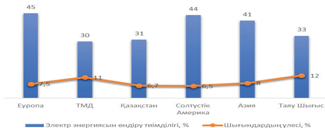
Сурет 2 – Электр энергиясын өндіру және тарату тиімділігі (2022 ж.)

Энергетикалық жабдықтың басым бөлігі – 65%, 20 жылдан астам жұмыс істейді, оның ішінде шамамен – 31%, 30 жылдан астам пайдаланылған. Энергия өндіруші жабдықтар мен желінің тозуы сәйкесінше 70% және 65% құрайды. Осылайша, 2022 жылғы жағдай бойынша электр энергиясын жеткізу және таратудың жалпы жүйелері бойынша электр энергиясын жеткізудегі ысыраптар 6,7% құрайды (2-сурет).