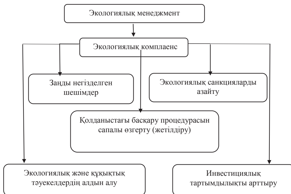
Сурет 4 – Экологиялық комплаенсты қолданудағы артықшылықтар

Ескерту: [8] дереккөз негізінде авторлармен құрастырылған.