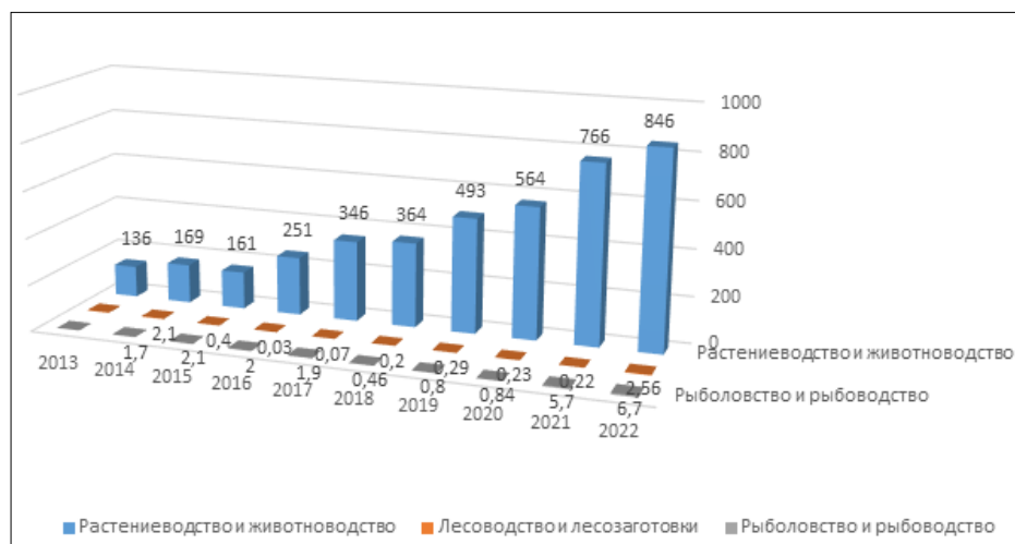
Рисунок 3 – Инвестиции в основной капитал сельского хозяйства в разрезе отраслей

Примечание: Составлен авторами на основе данных [19].