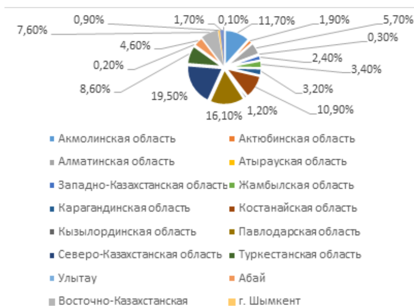
Рисунок 4 – Удельный вес регионов в республиканском объеме инвестиций в основной капитал в сельское хозяйство

Примечание: Сформирован авторами на основе данных [19].