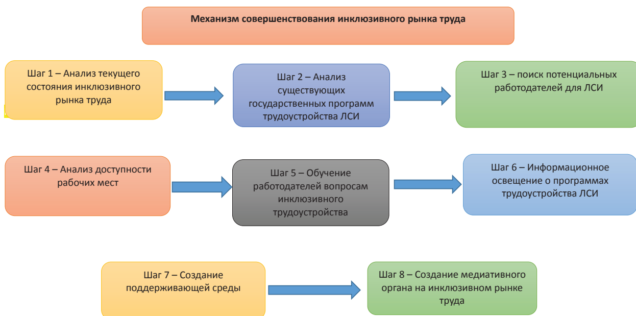
Рисунок 5–Механизм совершенствования инклюзивного рынка труда