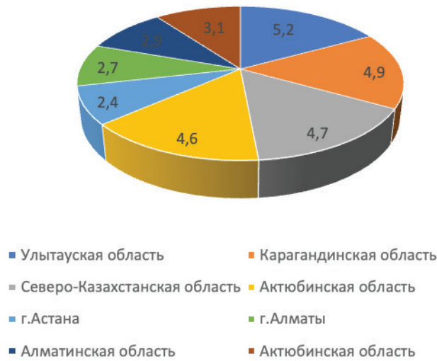
Рисунок 2 – Структура количества лиц с инвалидностью в разрезе регионов Казахстана

Рисунок 2 иллюстрирует процентное соотношение количества лиц с инвалидностью по регионам Казахстана.