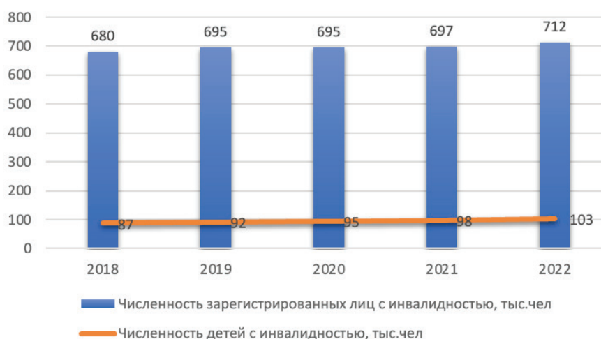
Рисунок 1 – Численность взрослых и детей с инвалидностью в Казахстане за 5 лет

Рассмотрим численность лиц с инвалидностью в Республике Казахстан, в том числе с детской инвалидностью. На конец 2022 г. в Республике Казахстан зарегистрировано 172 тыс. человек, или 3,6% от населения Казахстана (рисунок 1).