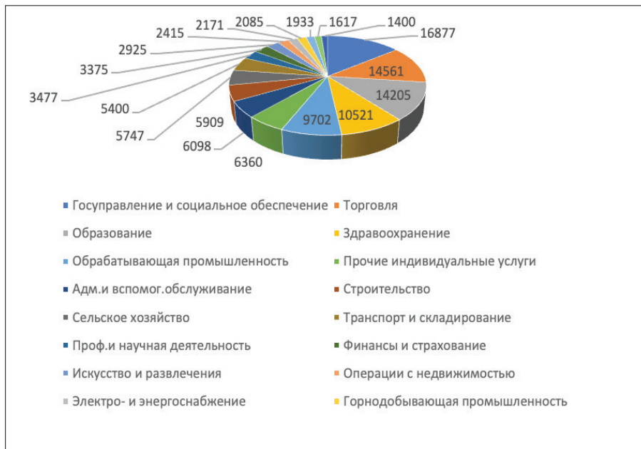
Рисунок 4 – Структура занятых лиц с инвалидностью по отраслям

Примечание: Составлено авторами на основании [16].