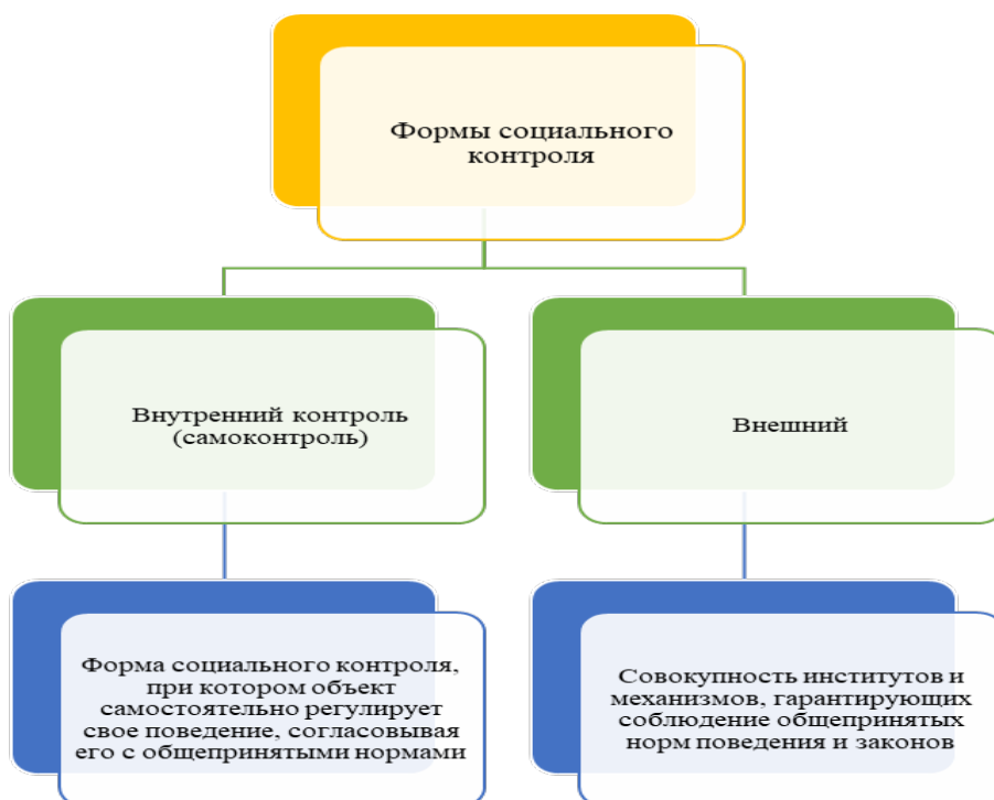
Рисунок 4 – Формы социального контроля

Таким образом, внутренний контроль не только снижает риски и повышает эффективность управления, но и способствует устойчивому развитию социального предпринимательства. Формы социального контроля представлены на рисунке 4 и включают в себя внутренний контроль, который предусматривает самоконтроль.