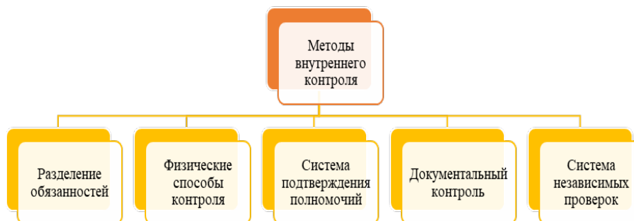
Рисунок 2 – Методы внутреннего контроля

Формирование внутреннего контроля предполагает использование методов, представленных на рисунке 2.