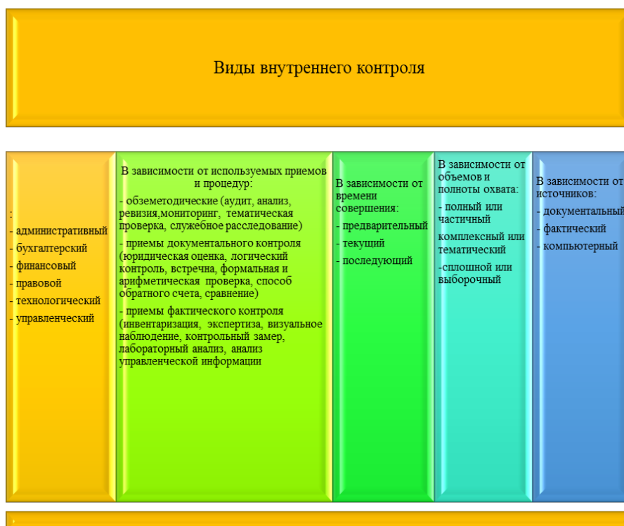
Рисунок 3 – Виды внутреннего аудита

Примечание: Составлено на основе источника [18].