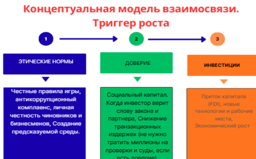
Рисунок 2 – Модель взаимосвязи «Этические нормы → доверие → инвестиции»

Примечание: Составлено авторами на основе источников [11, 12].