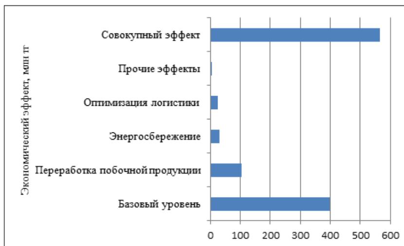
Рисунок 1 – Декомпозиция совокупного экономического эффекта внедрения замкнутой цепи поставок, млн тг

Для выявления структуры формирования совокупного экономического эффекта внедрения ЗЦП использован метод декомпозиции, результаты которого представлены в виде водопад-графика (рисунок 1). Такой подход позволяет определить вклад отдельных факторов в общий финансовый результат.