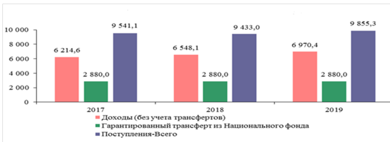
Рисунок 1 – Поступления в государственный бюджет, млрд тенге

С учетом привлечения гарантированного трансферта из Национального фонда в размере 2880,0 млрд тенге в 2017–2019 гг. общий объем поступлений в государственный бюджет прогнозируется с ростом с 9433,0 млрд тенге в 2018 г. до 9 855,3 млрд тенге в 2019 г. [3].