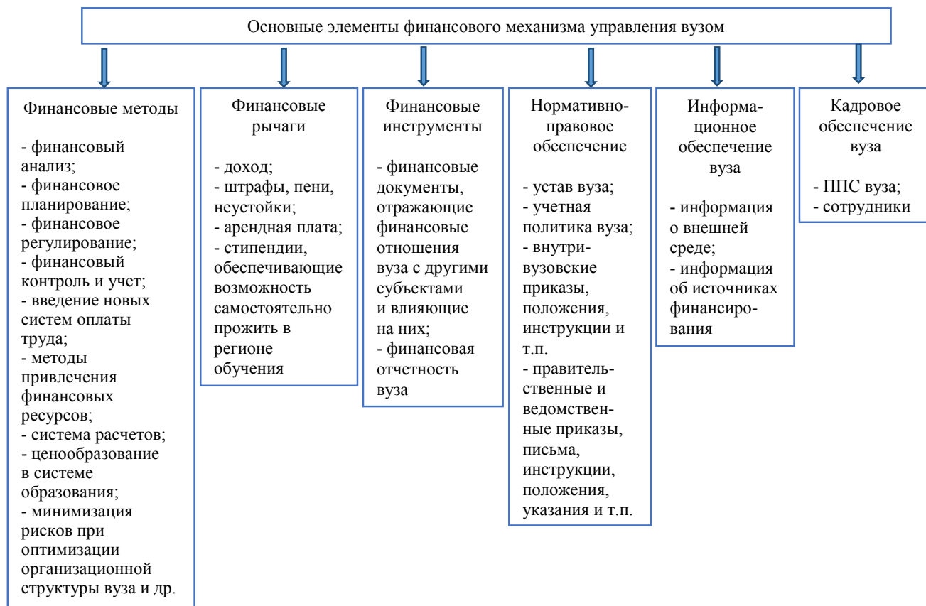
Рисунок 1 – Основные элементы финансового механизма управления вузом

Каждый отдельный элемент механизма является составной частью целого. Они взаимосвязаны и взаимозависимы, а сочетание элементов финансового механизма образует «конструкцию финансового механизма» [4].