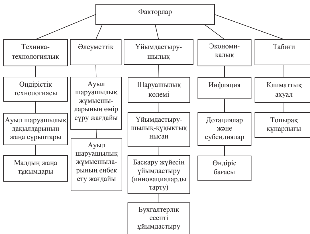
Сурет 1 – Ауыл шаруашылық ұйымдардың өндірістік іс-әрекетінің тиімділігіне әсер ететін факторлар

Ауыл шаруашылық ұйымдардың өндірістік іс-әрекетінің тиімділік деңгейіне белгілі әсер ететін факторларды келесідей топтарға біріктіруге болады: техника-технологиялық; әлеуметтік; ұйымдастырушылық; экономикалық; табиғи (сурет 1).