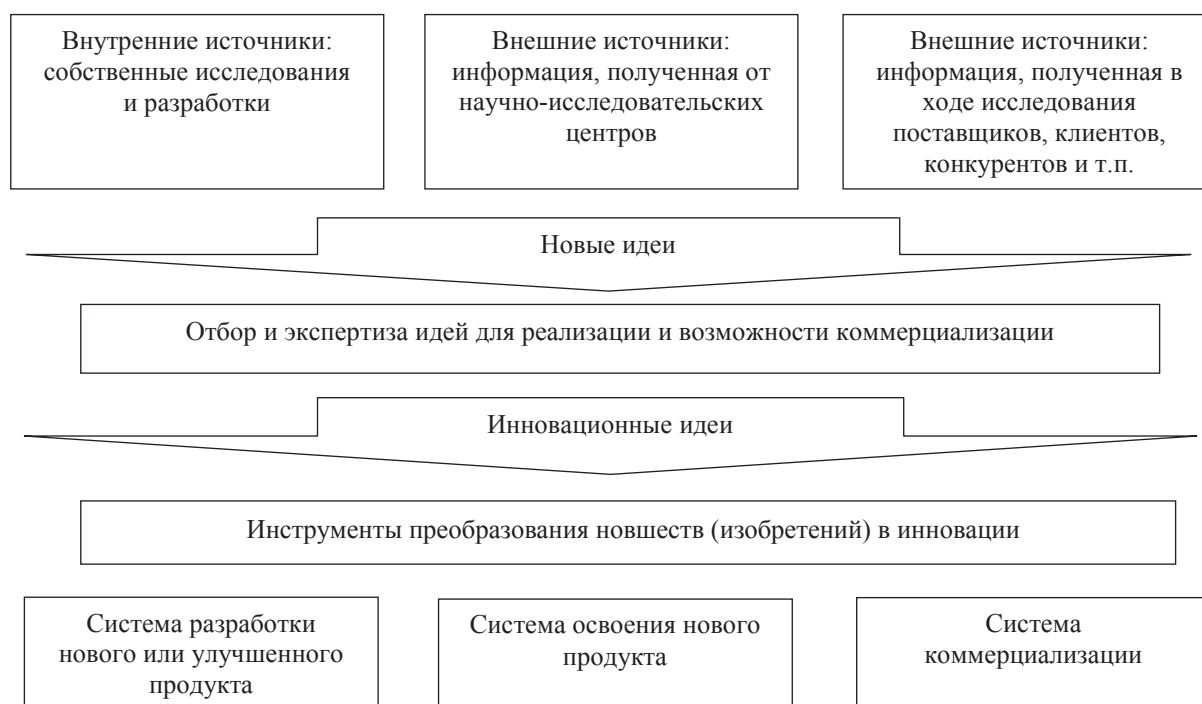
Рисунок 3 – Процесс инновационной деятельности предприятия

В кратком виде процесс инновационной деятельности представлен на рисунке 3.